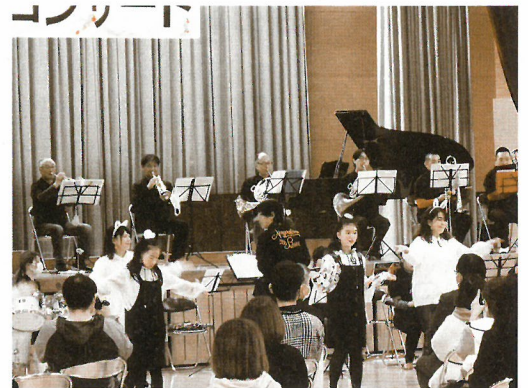
息の合った演奏とダンスを披露しました

このコンサートは今回で11回目を数えます。今年は、構成や入場者について検討を重ね、児童と保護者を主な演奏者とするコンサートとなりました。長島オールスターズは、メンバーによる演奏、歌、6年生児童と保護者がダンスで参加した曲など6曲を披露しました。距離をとりながらの演奏でも、音を通して心がつながり、充実した時間を過ごすことができました。また、感染症対策もしっかり行い、これからの音楽会のあり方を考える機会にもなりました。