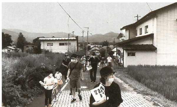
12区 防災散歩と交通安全教室