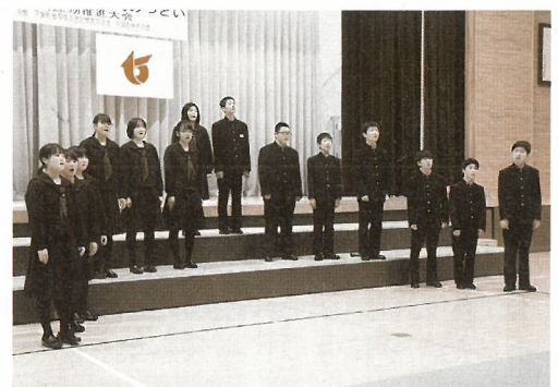
昨年度の平泉中学校生徒による成果発表