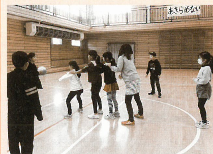
放課後子ども教室 (長島小学校) 子どもたちと一緒にボールを使った運動に参加。