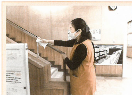
消毒ボランティア (長島小学校) 放課後、子どもたちが帰宅後に行います。