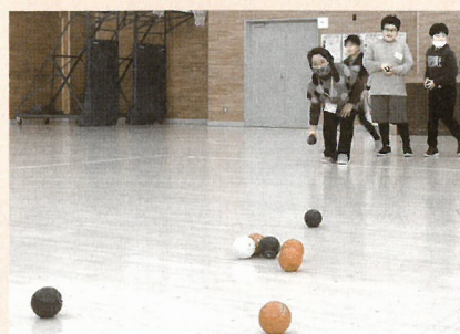
放課後子ども教室 (平泉小学校) 子どもたちと一緒にボッチャを体験♪