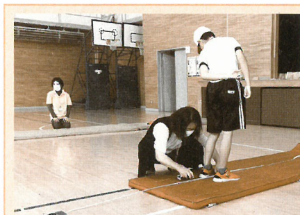
スポーツテスト補助 今年はどれくらい跳べるようになったかな?