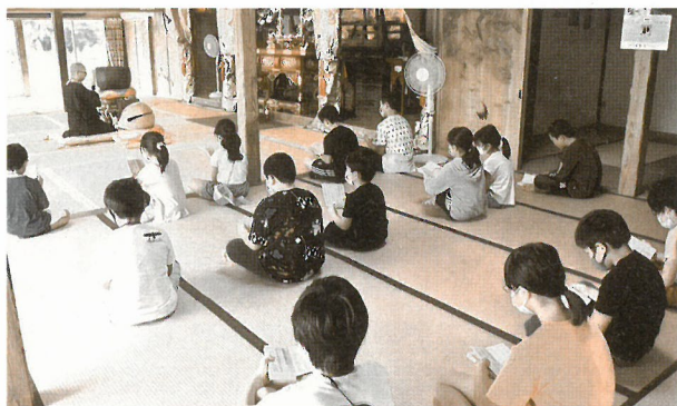
15区 見性寺での座禅体験

新型コロナウイルスの影響で思うように活動ができない状況にありますが、各地区PTAを中心に地域の方々の協力を得ながら、活動中のマスク着用の徹底や、外での開催により三密改善を図るなど、基本的な感染対策を講じた上で、子どもたちへの体験の場の確保に努めています。