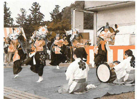
産業まつりで「御神楽」を披露