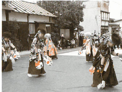
中尊寺通りホコ天まつりでの実践発表