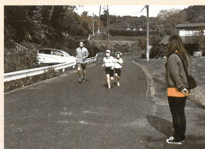
マラソン大会の安全見守り 「最後まで頑張れ!!」応援しながら見守ります。