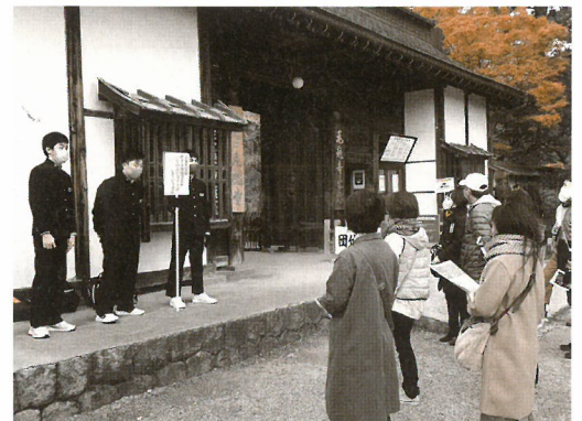
郷土愛たっぷり「平泉ガイド体験」

平泉中学校では、3年間で「過去を知る」「今を見つめる」「未来に広げる」をテーマに「郷土・平泉学」に取り組んでいます。その集大成となる活動が「平泉ガイド体験」です。11月7日、3年生の生徒64名は毛越寺と観自在王院跡の2カ所の史跡で、郷土への思いを込めた自分たちのことばでガイド体験を行いました。今年度はウイルス感染を防ぐため、3年生の保護者に限定しての実施となりましたが、平中の伝統を受け継ぎ、郷土愛にあふれたガイドを無事終えることができました。