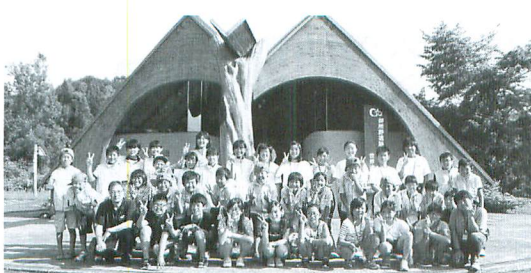
昨年の一戸町での「御所野愛護少年団」との交流