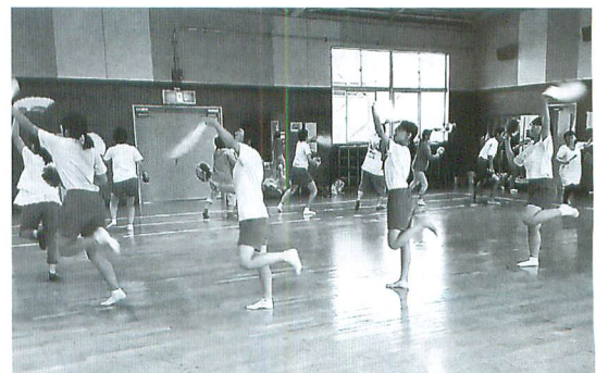
今年から小学5年生～中学3年生が対象