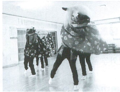
10区 子ども獅子舞体験