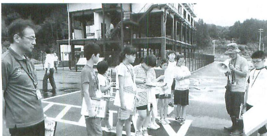
昨年の宮古市での復興学習の様子

今年は8月2日～4日の2泊3日で世界遺産の栃木県「日光」と、平泉と歴史のつながりが深い福島県白河市・国見町などを訪問します。