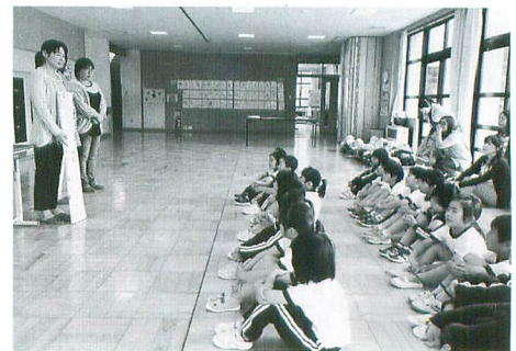
図書ボランティアによる読み聞かせ

その他にも、たくさんの分野のボランティア活動があります。 興味のある方は、協議会事務局までお問い合わせください。