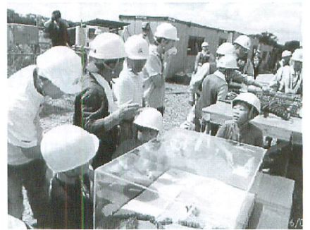
19・20区 長島水門についての学習