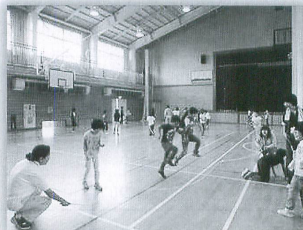
放課後子ども教室ボランティア