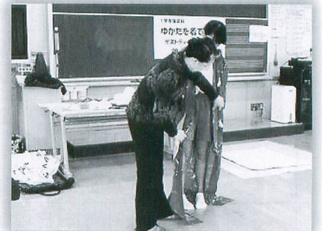
ゆかた着付けボランティア