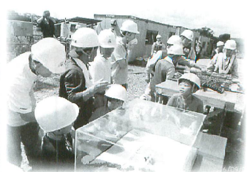
[20区] 遊水地・長島水門現地学習