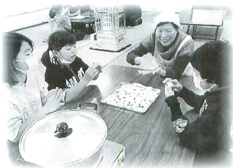
[1区] 果報だんご・ぜんざい作り