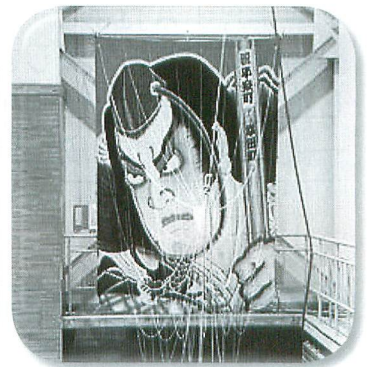
災害時相互応援協定を締結している愛知県幸田町の伝統芸能「三河万歳」。迫力ある6畳の大凧も会場を飾りました。