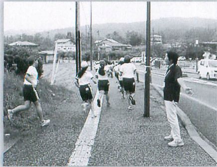
学校ロードレース大会ボランティア

平成28年度も多くの地域ボランティアの皆様のご協力をいただきながら、子どもの安全で安心な教育環境の整備・充実を図ることができました。