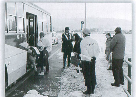
スクールガードボランティア