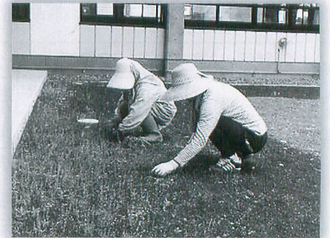
環境整備ボランティア