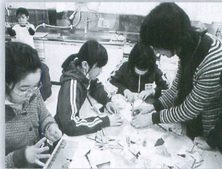
創作活動ボランティア