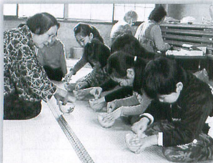
茶道教室ボランティア