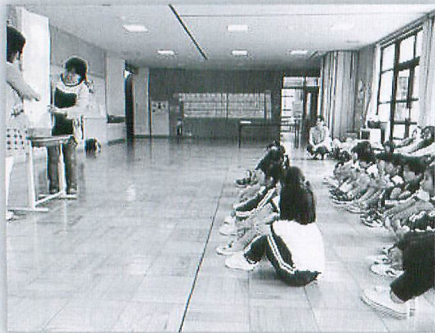
絵本読み聞かせボランティア