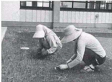
学校周辺の草取りで環境整備をしてくれるボランティアさん