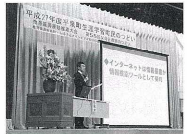
講演会を通じて理解を深めます

情報メディアの使い方について、家庭内でのルールを決めるほか、授業参観日（11月22日）を利用して、メディア依存に関する内容の講演会を児童・保護者対象に開催しながら、情報メディアの利便性や危険性などについて学習します。