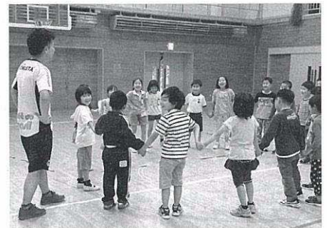
体を動かすことの楽しさを教えてくれるボランティアさん