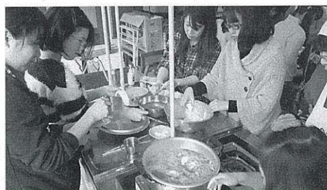
地区子ども会「はっ斗づくり」の様子