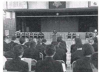
生徒会でも積極的に呼び掛けます

平成26年度地区懇談会でメディア利用に関する課題が話題に出されPTAの話し合いを進めた結果、「日曜日の午後9時以降のパソコンやゲーム機などの情報メディアの利用を控える」と決め、今年度も継続して取り組みます。