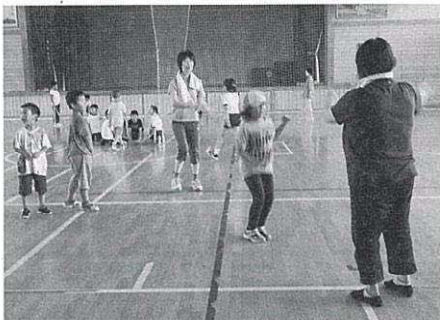
放課後わくわくフィールドで一緒に遊んでくれるボランティアさん

子ども達との交流を図りながら、また、子ども達の活動を楽しく見守りながら活動ができるとてもやりがいのある活動でもあります。地域の力で子どもを育てる活動にぜひ皆さんも参加してみませんか。