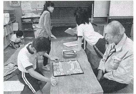
将棋を教えてくれるボランティアさん。 子ども達は将棋大好きです！