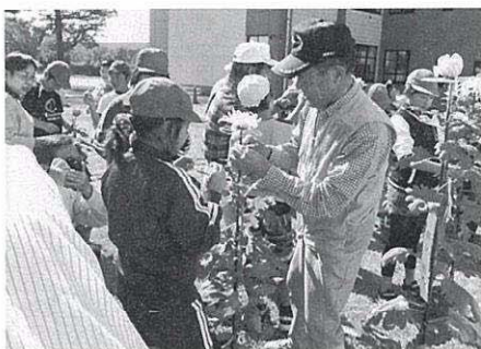
中尊寺菊まつりに向け、菊の作り方を教えてくれるボランティアさん