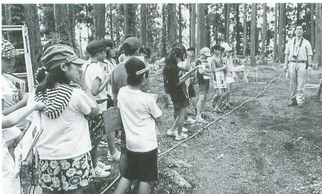
金沢柵で清原氏の歴史を学ぶ団員