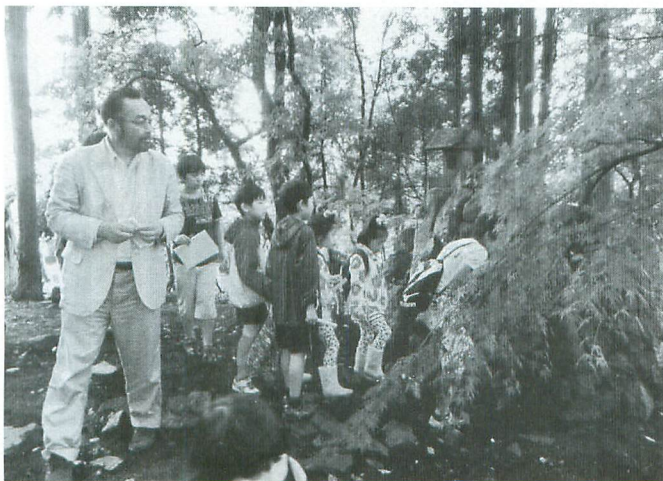
「お大師様」の歴史について学ぶ14区の子も達

地域学習を通して、地域の大切な遺産や伝統文化を知り、郷土に愛着の持てる人材の育成を目指してこれからも活動していきます。