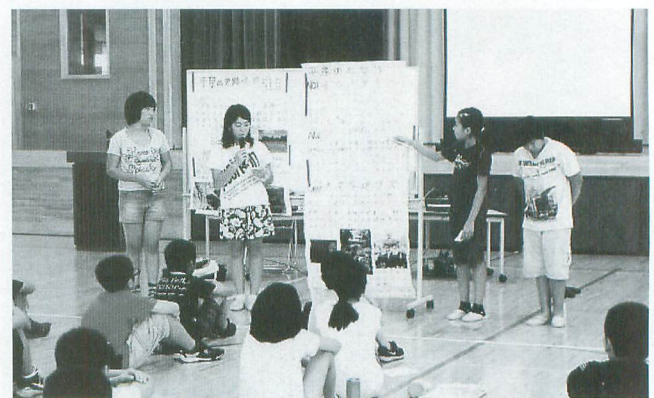
手づくりのパネルを使って平泉をPR