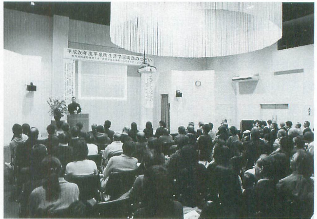
多くの町民が参加した昨年度の大会

自転車で世界一周を成し遂げた体験談やアフリカで「恩返し井戸」を掘ったことなど様々なお話をいただく予定です。