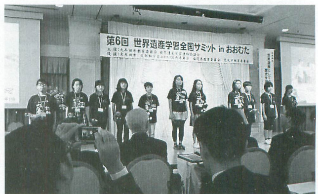
今年開催された「全国サミットinおおむた」で地元の小学生が大牟田市のまちを紹介する様子

開発のための教育)を推進する全国の教育関係者約600人が集まり、世界遺産などを活用した学習に取り組んでいる学校の先進例を学び合いました。