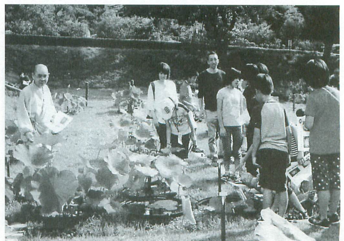
中尊寺大池の「中尊寺ハス」について学ぶ2区の子も達