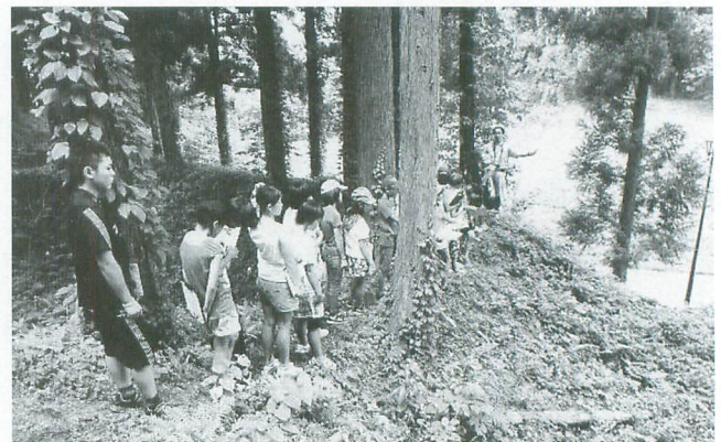
大鳥井山遺跡の『土塁』から『お堀』を眺める様子