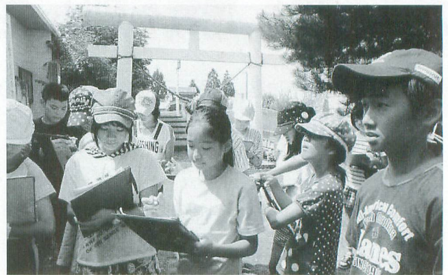
『錦神社』は四代泰衡公を祀っています