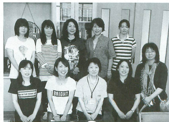
子ども達はたくさんのボランティアのみなさんに支えられ、すくすくと成長しています！

教育支援活動ボランティアは、地域の方ならどなたでもご参加いただけます。お手伝いいただける方、興味のある方は、教育委員会（担当：地域教育コーディネーター）までぜひご連絡ください。お待ちしております！