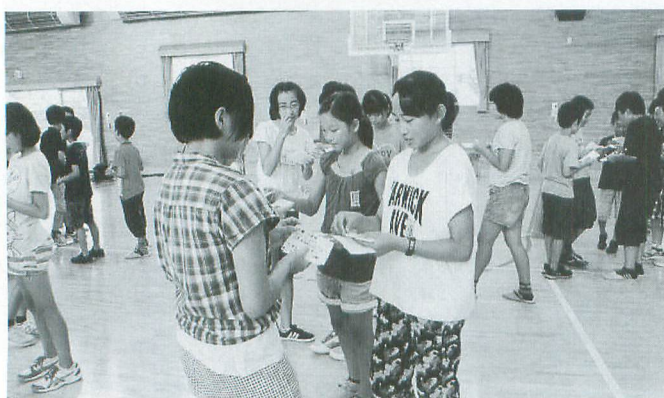
大雄小の児童と手づくり名刺の交換で自己紹介