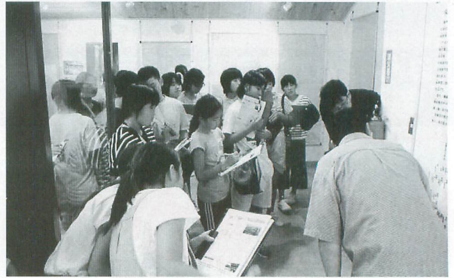
『十三湊』から中国の貢物がたくさん運ばれてきました

また、3日目には、児童交流として『横手市立大雄小学校』を訪問し、パネルを使ってのお互いの町の紹介や、平泉と横手の歴史的なつながりについて一緒に学び、交流を深めました。