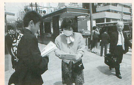
昨年度の『平泉アピール活動』の様子