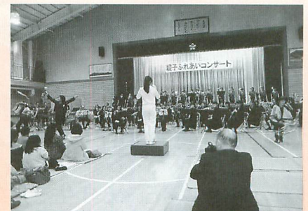
昨年度の『親子ふれあいコンサート』の様子