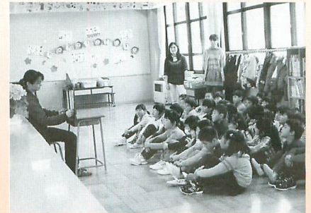
『朝読書読み聞かせ』の様子