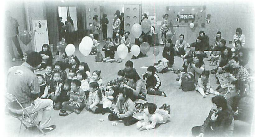
親子ふれあい教室『絵本読み聞かせ』の様子