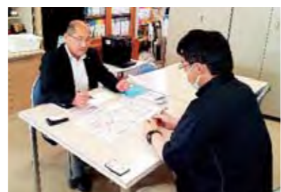
負担金の負担軽減を

大な負担となり、担い手不足にも拍車をかけている。国土保全、食料の問題は国が責任を取るべきではないか。町が行う省庁交渉の要望に入れることは検討できないか。