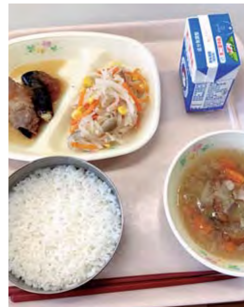
子どもに無償で給食を

問 学校給食費無償化は、全国の自治体に広がり、国の認識を変えてきた。当町も無償化を実現するべきではないか。