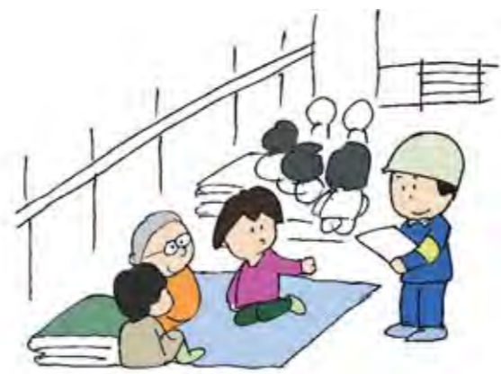
安心安全な避難と避難所の構築を

問 町防の防災マップに、災害警戒区域内に避難場所を指定している箇所が見受けられる。災害の種類により詳細な避難場所を指定することで、支援対応を円滑に行うことができるのではないか。