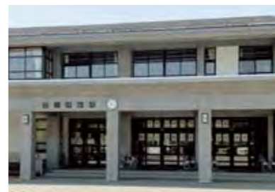
多人数クラスに副担任を