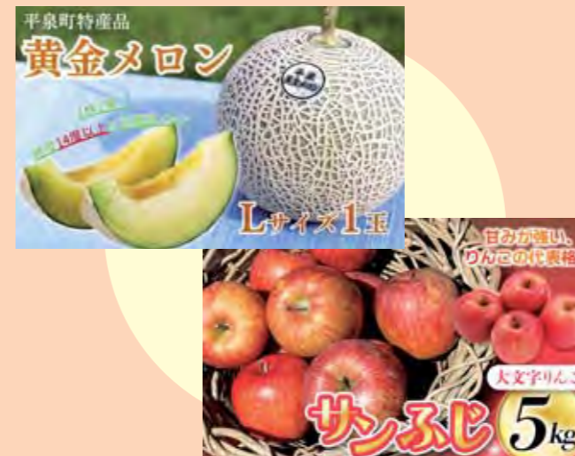
平泉のアピールを