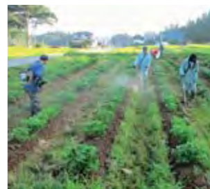
休耕田の有効活用を