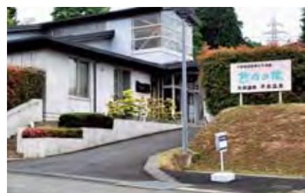
経営改善を待つ「悠久の湯」

町長 一般会計か ら多額の繰り 入れの依存体質であ り、早期に対応すべき もの、慎重に検討し対 応すべきものを整理 し、改善の取組みを進 める。