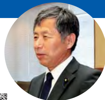
阿部 圭二 議員