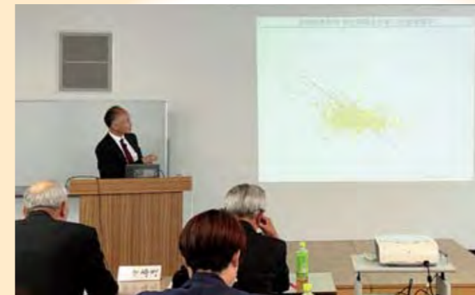
地方自治は課題が様々