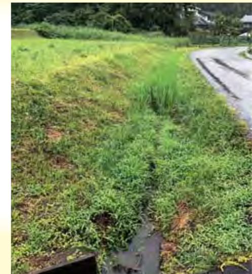
整備を早急に (4区内)