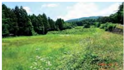
増える耕作放棄農地

人口減少にあえぐ地方の活性化の手段として、地方と都市の双方に生活拠点を持つ二地域居住を促進する法案が成立しました。地方の活性化の転機になります。