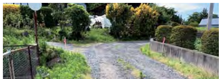
令和9年度完成予定の大佐3号線

令和9年度の完成を目指し、町道樋ノ沢大佐線と町道大佐3号線を合わせて幅員5m、640mにわたってアスファルト舗装で整備