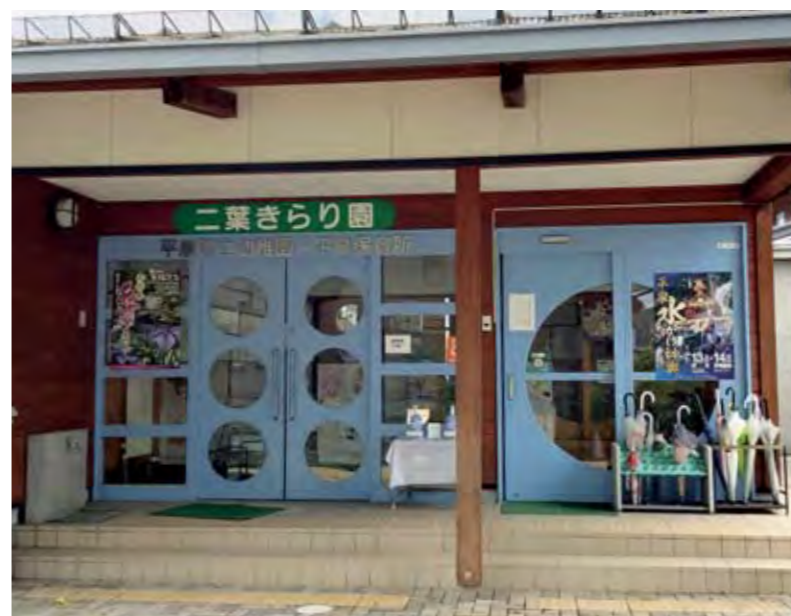
子どもたちの元気な声が響く二葉きりり園

町長 健診や保育段階の気づきが重要であり、必要性を認識している。実施には医師などの専門職の確保が必要であり、教育委員会などと協議しながら準備を進めていく。