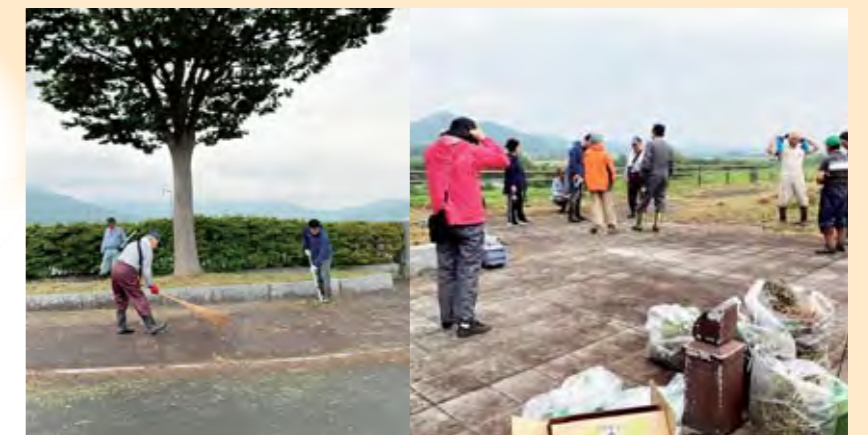
事務局も参加しての環境整備

6月23日、平泉町議会と事務局で高館橋西側の清掃を行いました。20年以上前から清掃は毎年行われており、今後も環境美化整備に努めてまいります。