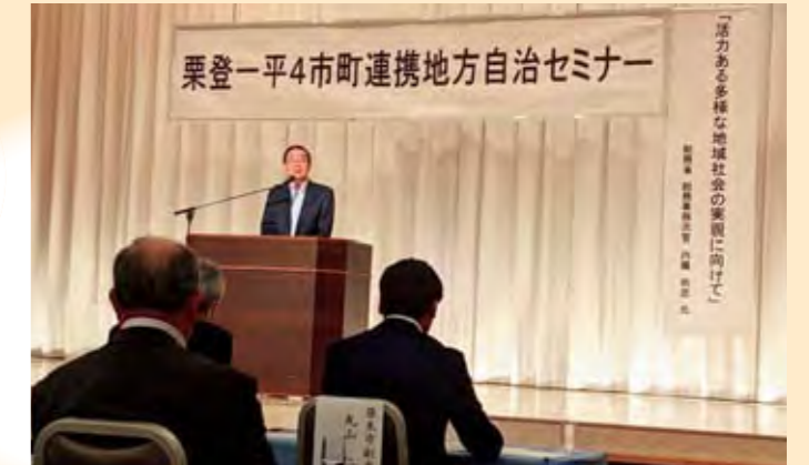
自治体間の横のつながりを

5月24日、ホテルグランドプラザ浦島において、栗原市、登米市、一関市、平泉町の議員が集まり「自治体DX」「防災・減災に向けた取組について」等についての研修が行われました。