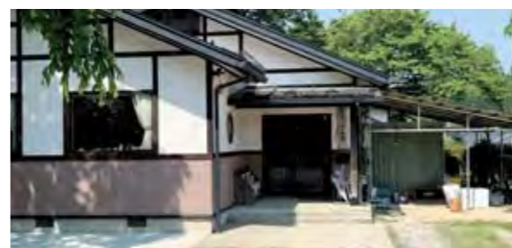
常時開所できる児童クラブを

子育て支援課長 面積要件は満たしており問題ない。しかし6年生には狭いと思われる。隣の校庭をうまく利用していきたい。