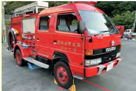
消防車両は必須 (第七分団)