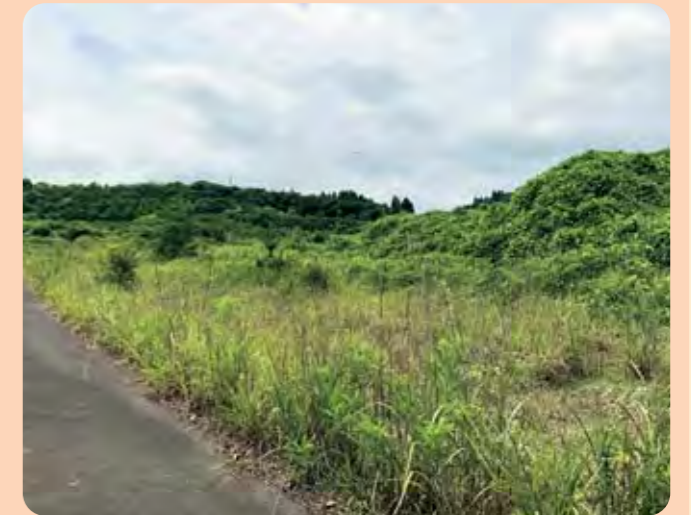
新たな工業団地を