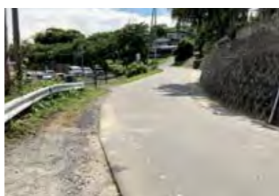
歩行者の安全確保を（町道倉町線）