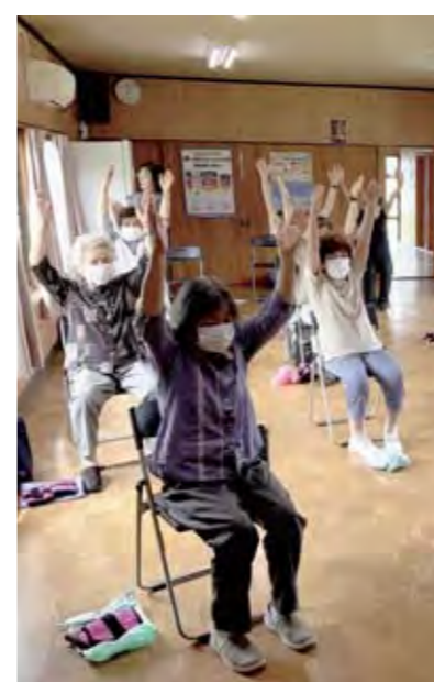
難聴者でも百歳体操を

5年平均の合計特殊出生率は金ケ崎町が県内1で、給食費無償化を始めました。平泉町こそが行うべきではないでしょうか。