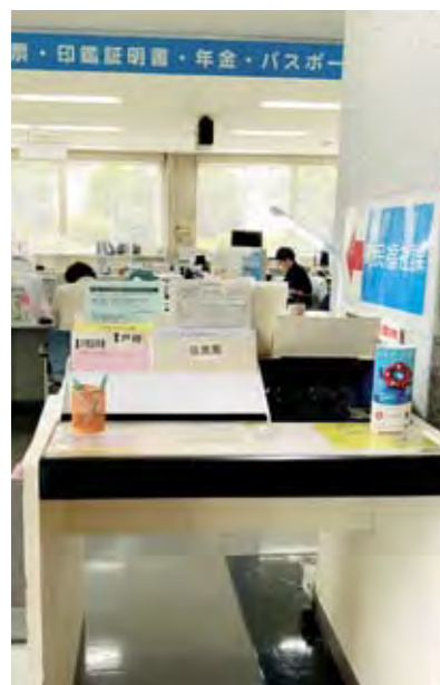
書かないワンストップの窓口へ

町長 庁内で組織するDX推進ワーキンググループ会議で本年度の検討事項となっている。今後、現状に合った窓口と、タブレット端末導入の必要性を検討する。