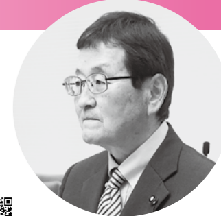
議員 幸 光 みつ ぐみ 真 筆