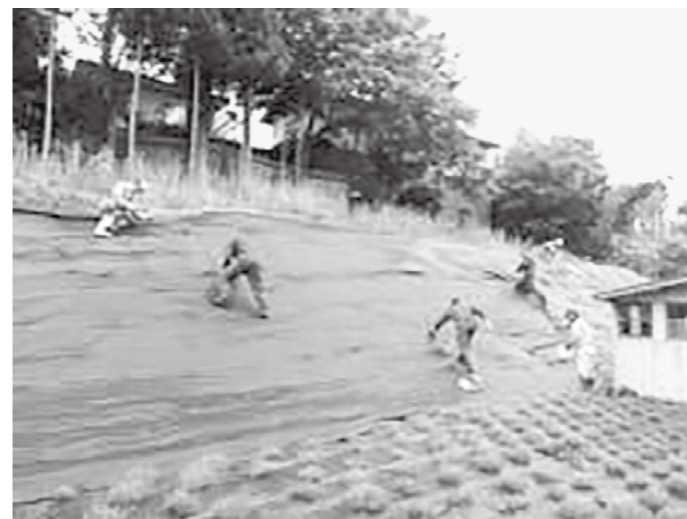
地域が参加する景観・環境保全事業

問 旅行先にふるさと納税すると、返礼品として現地で使える電子商品券がもらえる「旅先納税」の導入を検討できないか。