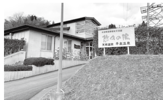
町民の憩いの場の今後は

問 燃料費高騰の影響は 答 各施設の光熱水費、燃料費が増額補正されているが、どの程度の負担の上昇が見込まれているのか。 答 電気事業者の値上げに伴い、全体で2000万円程度の支出増加が見込まれている。各施設とも冬期の節電に努めている。 問 電気料金の高騰に伴い、新電力会社への変更、または再契約は考えているのか。 答 町にとって有利な事業者との契約を考えているが、電力事業者との契約先を変更できないような状況もある。引き続き安定した運営を目指したい。