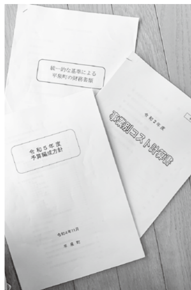
自治体経営にはコスト意識も必要では (コスト計算書は日野市の資料より)