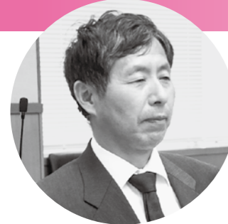
議員 圭 二 けい じ 部 阿