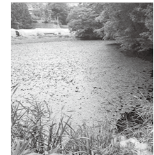
浸食が進む花立ため池