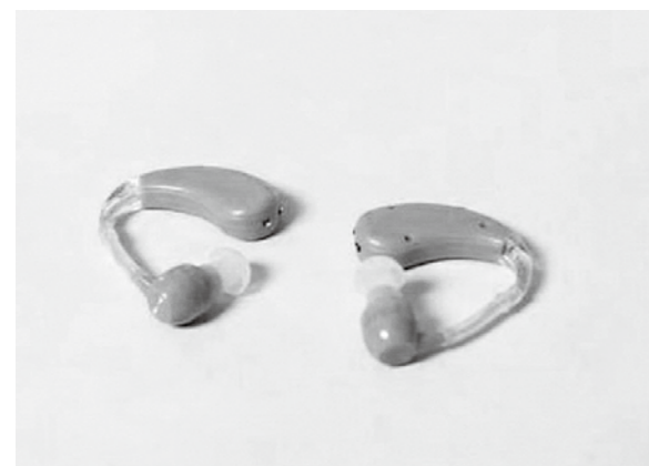
補聴器で難聴者が普通に暮らせる町を

保健センター長 難聴が発生の要因に含まれている。補聴器が必要かも含めて相談してほしい。