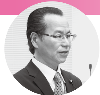
議員 正 葉 稲

問 AEDが設置されているにもかかわらず、それが適切に使われずに失われた命もある。中学校でも、今後一斉講習を考