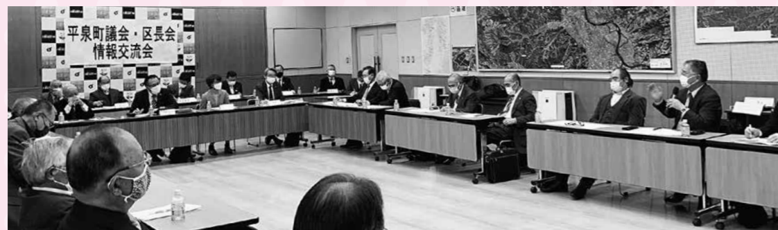
区長会との情報交換会