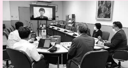
タブレットを使用したオンライン会議

選挙権年齢が18歳に引き下げられたことを踏まえ、若いうちから政治について考え、触れる機会をつくるのが大切だと思います。町民の意見が議会でのように取り上げられているか、町民代表である議員による議会活動がどう行われているかをSNSの活用により、理解していただく必要があると考えます。