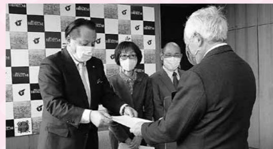
コロナ対策を町に要望