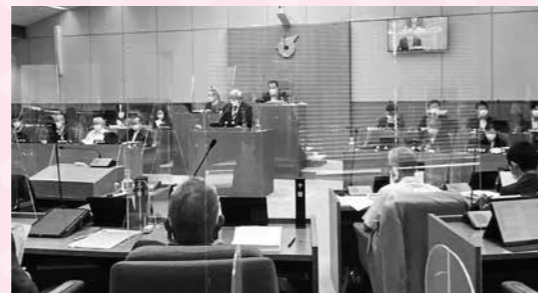
熱い議論が交わされる本会議

防災無線は、命を守る情報を、全町民に平等に知らせる伝達手段では？なぜ、全町民に配布しないのでしょうか。議会は可決された予算執行の検証を必ず行ってほしいと切に願います。