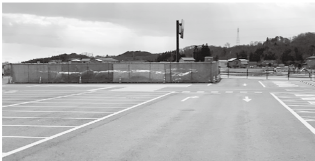
令和5年度にはトイレも備わる

問 今後の利活用の方向性は。 答 藤原まつりの駐車場として、シャトルバスの運行も検討している。大型の駐車場を生かすためにも、今後様々なイベントを開催していきたい。