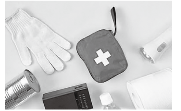
防災グッズの確認を！

町長 人と人の密を避けるため、多くの避難所を開設し、ホームページやアプリケーション等を活用し、周知する。要配慮者に考慮し、ホテル、旅館等の受け入れ可能な施設の把握に努める。