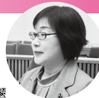
大友 仁子 議員