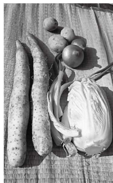
グリーンツーリズムで生活を豊かに