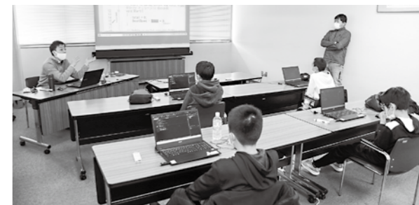
昨年実施の児童・生徒のプログラミング教室