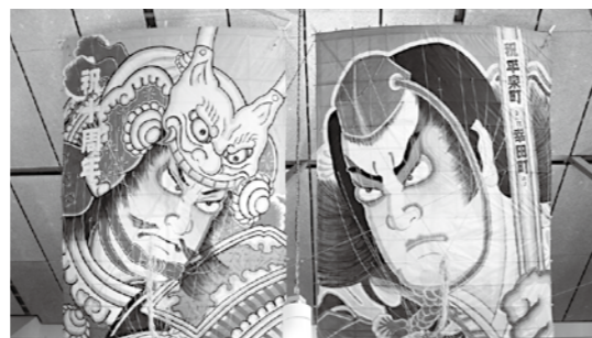
災害協定を締結している愛知県幸田町から寄贈の大風(道の駅ホールに展示)