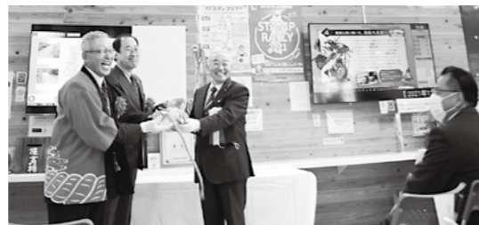
11月21日に行われた贈呈式