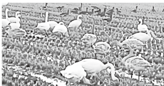
白鳥は米価暴落を知らません

一昨年の同時期に比べて売上げが減少していると回答した事業所は8割。運輸業、宿泊業は100%、小売・飲食業は96%と、厳しい状況が継続している。状況を注視し、平泉商工会や平泉観光協会、関係各所と緊密に情報交換や意見交換を