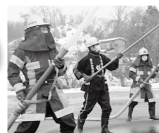
地域防災の要、非常備消防団

町民から選良された議会議員としての責務、理想と現実の狭間で問われる議員の判断と資質。町民の負託に応える、あるべき議員の姿を考えさせられた12月会議の審議かな。次への展望をどう作り上げるか？