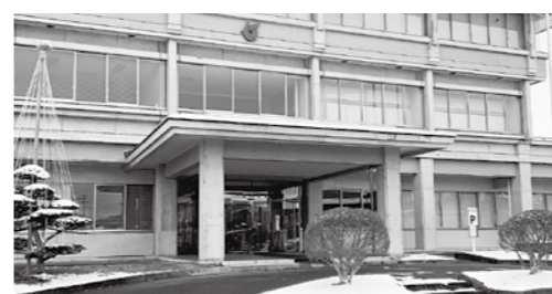
役場以外にも期日前投票所を