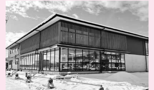
人づくり、学び、情報交換、交流の場 令和4年7月オープン予定

答 当日の理由のないキャンセルを防ぐためである。事故や天災等のやむを得ない場合は返金する。