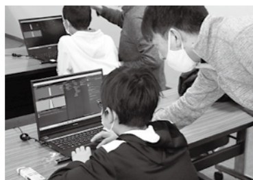
子どもたちに豊かな発想を

町長 地方創生推進交付金の採択を受け、2分の1が国、2分の1が町の負担となり、町負担の8割が交付税措置される。