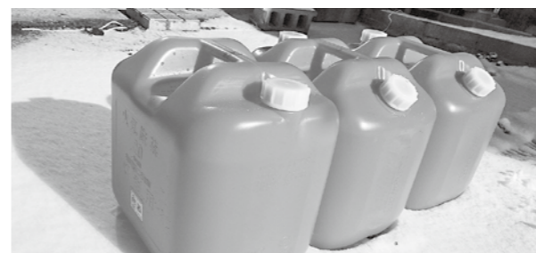
福祉灯油が少しでも家計の助けになればいいですが

保健センター長 難聴と生の因果関係の調査が令和4年以降にまとまる見込みで、国の動向を見ながら補聴器の効果等を見ていく。