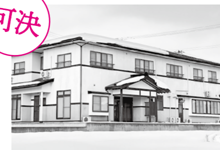
事業活動を志す人の拠点に