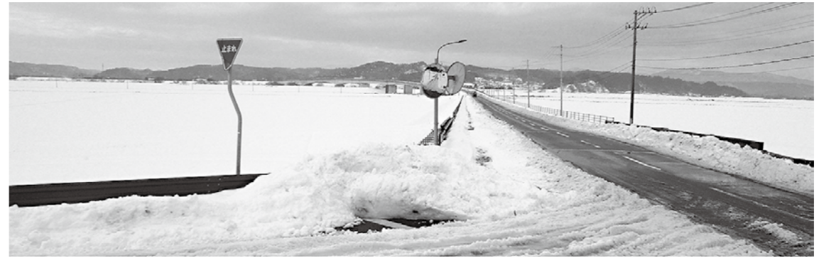
役場や駅までのアクセスが不便である