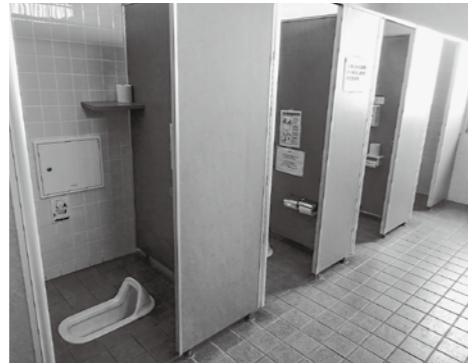
洋式化が望まれる駐車場トイレ