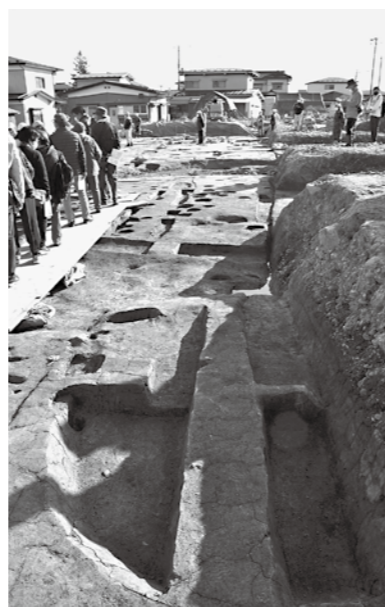
志羅山遺跡第118次調査

文化遺産センター所長 現行制度で1名退職予定だ。これからの業務量、開発行為に伴う受身の対応で人数が不足している。こ