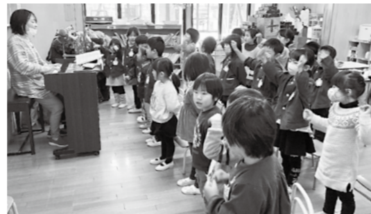
平泉幼稚園、年々入園児が少なくなっています。