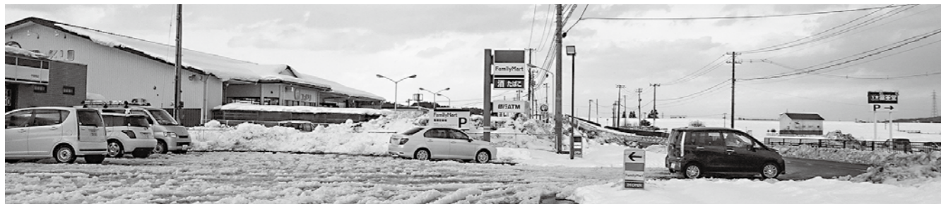
集合する商業施設