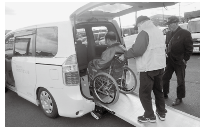
移送ボランティアの車いす送迎研修

これは2月号ですがナント、町がオンデマンド交通を秋から始めるとの報道です。何十年来の町民の願いが実現します。キチンとした施策実行へ皆さんで注視しましょう。