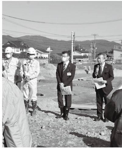
志羅山遺跡第118次調査報告会

総務課長 換気消毒、手洗いを実施してきた。今回の件については飲食店も含めて感染症防止対策をとっていたことで、こういった結果になったと考えている。