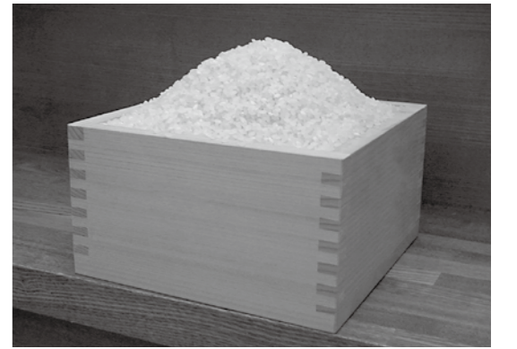
農家への減収対策の対応が早かった町

保健センター長 一関保健所に報告され、平泉に情報共有され、平泉に連絡が来る。感染者が発生した場合は県が中心となり、町と情報共有しながら対応していく。