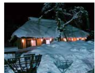
達谷窟西光寺御供所

神楽伝承のこれからについて 伝承芸能としての神楽の基本は変えてはならないけれど、南部神楽は大衆芸能として伝わり、楽しむ大衆があつてこそその芸能なので、時代に合わせて変わっていったらいいと思います。例えば、わかりやすい言葉のほつが伝わるとか。 これからも気負わずに、楽しみながら仲間と続けていきたいと語ってくれました。