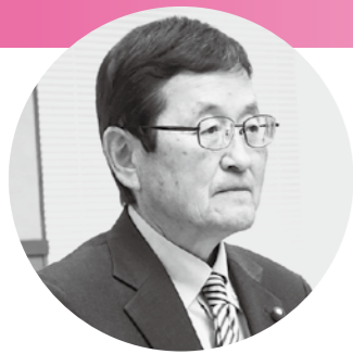
真 筧 光 幸 議員