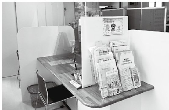
改修された保健センターのカウンター