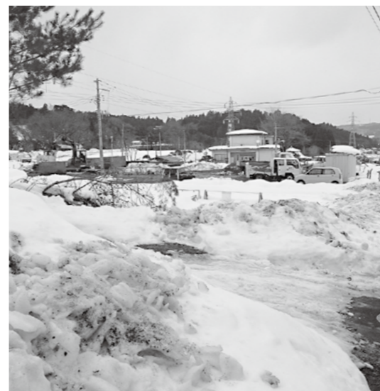
未利用地を使い戸建町営住宅建設を(花立住宅跡地)

町長 生活支援ハウスは、生活支援を要する高齢者が一定期間生活する住居で、日常生活ができる方が対象である。サービス付き高齢者住宅も整備されているので必要はない。