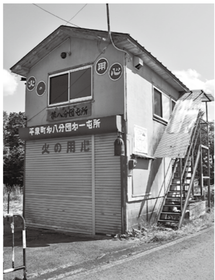
町内で唯一トイレが無い、旧小島小学校付近の8分団の屯所