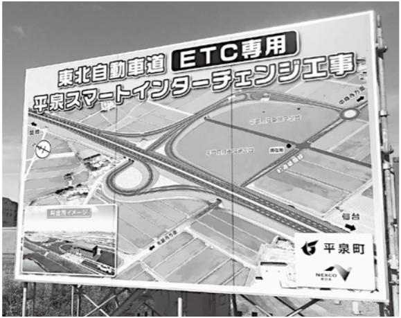
スマートインターチェンジ完成予定図

町長 事業の実現に向け民間主体の実行組織(仮称)平泉 S I C 事業戦略協議会を立ち上げたい。