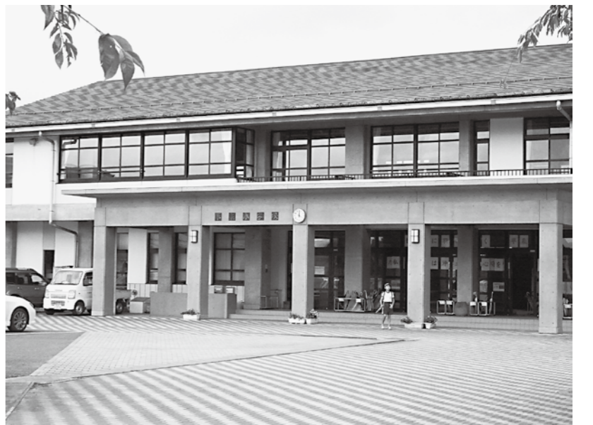
冷房設置が待たれる平泉小学校