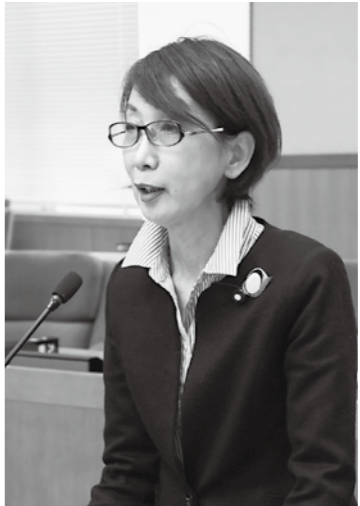
升沢 博子 議員