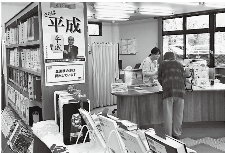
工夫を凝らした企画が人気の現在の図書館

教育長 従来のように町が雇用して配置ということはないが、対話の中で地元雇用について前向きな回答があるので、経験を生かして継続できるよう働きかけていきたい。