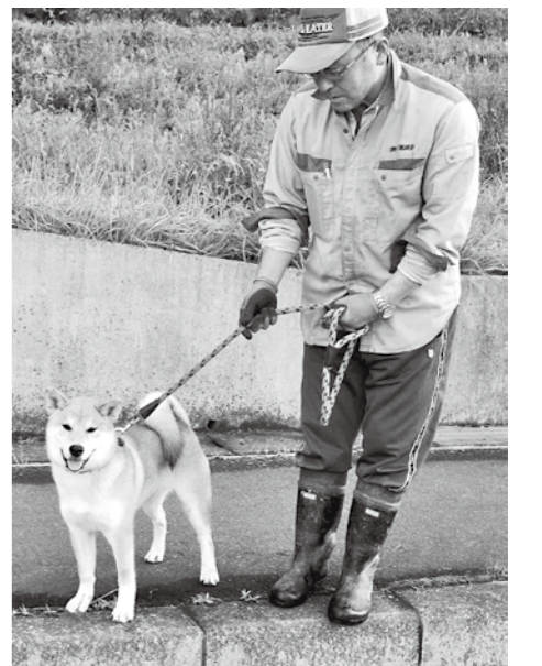
愛犬の“大地”と散歩

まちづくり推進課長 様々な要件はあるが、新規に結婚した世帯を対象に上限を20万円として新居の購入費、家賃、または引っ越し費用を助成している。子育て支援は保育所、幼稚園児、小中学生に対して教育環境を整え、さらには保育支援や就業援助、医療費助成を行っている。