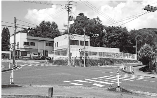
改善が望まれる長島七曲交差点

朝の通勤時間帯に川屋敷バス停から4号線にかけての渋滞のため、旧道を通りジョイス前交差点に出る通学路が歩道もなく危険であるが対策は。