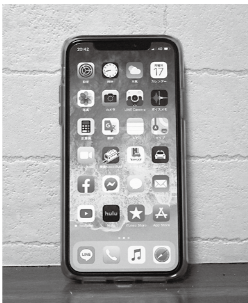
スマートフォンの小中学校持ち込み解禁は慎重に！

学習内容が増えて、子どものランドセルが重くなっています。平均6キロあります。学校も配慮していて、教室に置ける教材もありますが、地域の皆様も、子どもには重いという認識と配慮をお願いします。