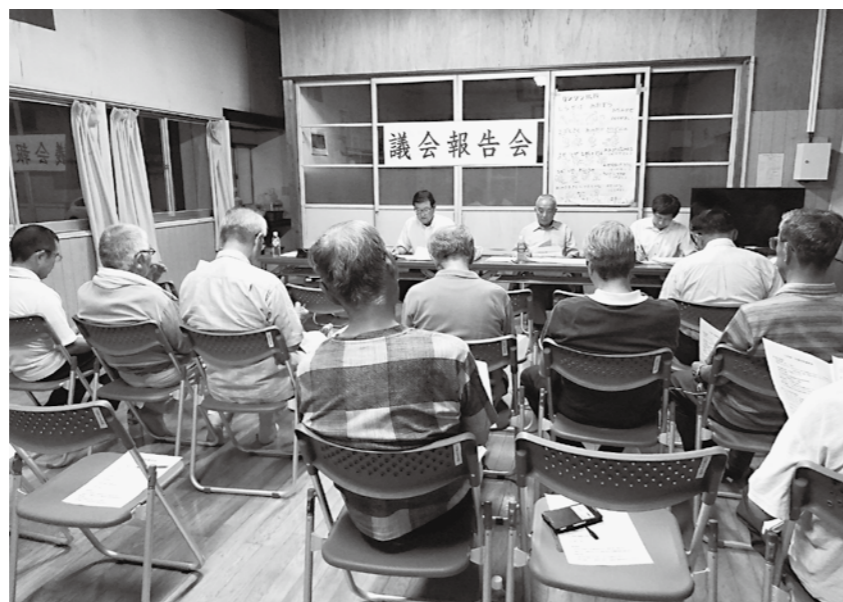
社会教育施設整備の報告 (下達谷公民館)

回答 議員定数・報酬についての議論、若者でもなれる改革を。傍聴者の増加を目指し、議会の夜間開催を。議会の負担もあるが報告会を各行政区開催にしてみてもいい。