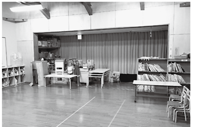
子供たちのためにより良い保育環境を（平泉町立幼稚園）

問 当町は現在、企業誘致に積極的に取り組んでいるが、保育所の受け入れ態勢が整わなければ誘致企業に付随