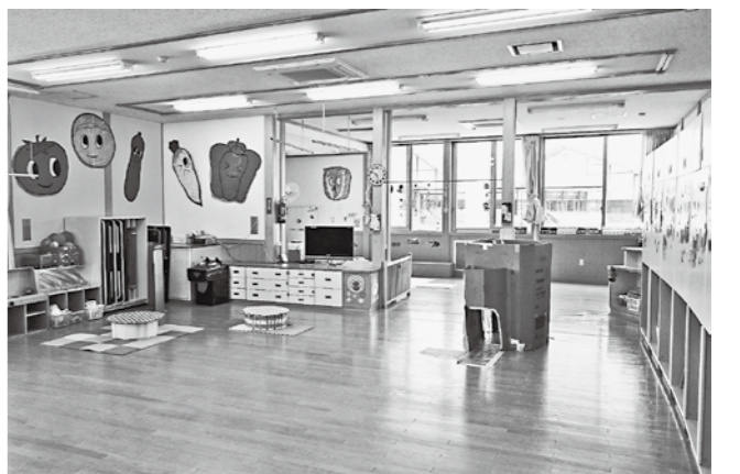
スペース確保のため奥行きを増築した角館こども園（秋田）