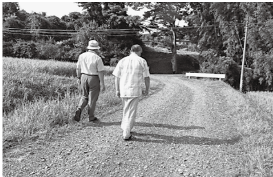
簡易舗装でもいいからお願いしたい

は生活道路としての利用度、危険度、費用対策効果等によりランク付けして、ランク上位の生活路線から順次整備を進める。町道森下線は今後5年間の実施計画には記載されていないが実施時期は町全体の道路行政の中で検討していく。