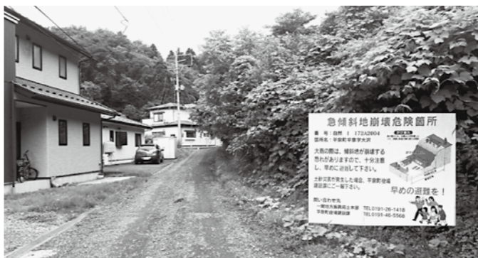
緊急性が高いと提言した未整備路線の一つ（町道ねずみ沢線）

町長 側溝土砂については、国による土壌の処理基準が示されていないことから、一斉清掃で泥上げをしないよう行政区にお願いしている。