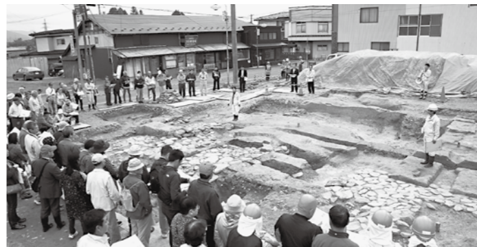
調査・整備が進む無量光院跡(現地説明会)

答 店舗改修に係る事業に50万円を上限に2分の1補助するもので当初予算の2件分は支出している。現在新たに