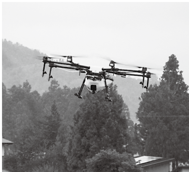
ドローンによる農業散布