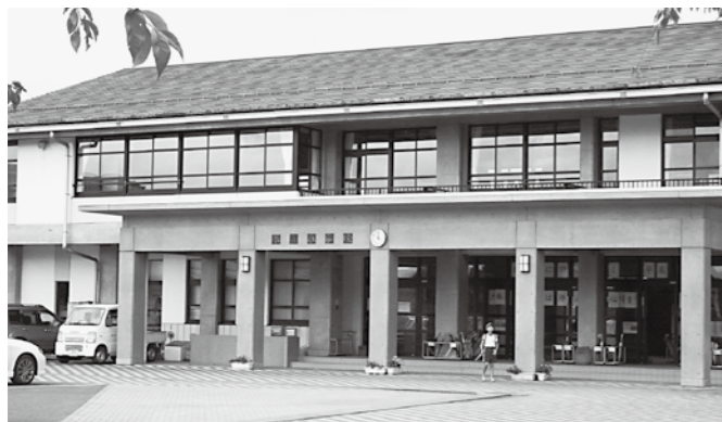
文科省は頑張っている全国の学校に補助金を

日本列島、災害だらけで平泉町でもいつ起きてもおかしくない、夏に起きた場合は体育館の避難所で熱中症にならないような対策が必要ですね。