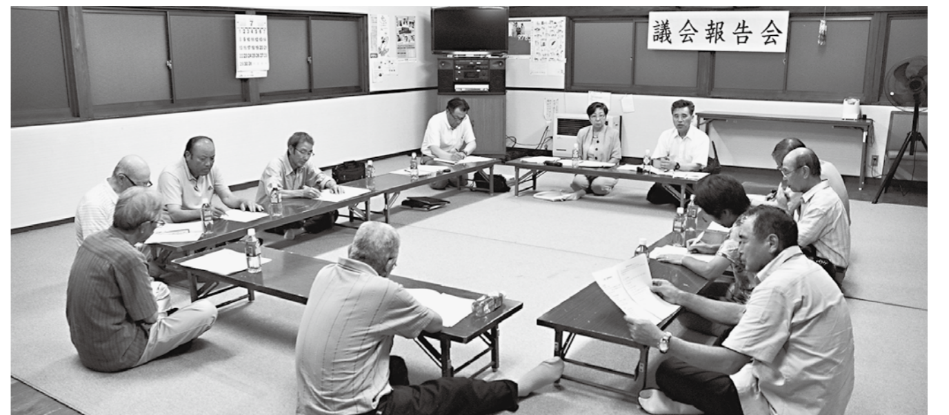
車で意見交換 (2区公民館)

回答 公民館・図書館の更新が早急に必要であるため、体育館については町の「基本構想基本計画」の中でPFI※で有利な資金などができれば早急に建設するとしている。場所については決まっていない。