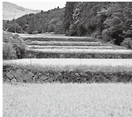
実りを迎えた長島の石積棚田

5月にごみ減量などのシンポジウムが開かれました。参加者は、ごみが半分に減ったと言います。排出の40%が生ごみです。その対策で4割削減できるんだけどなあ。