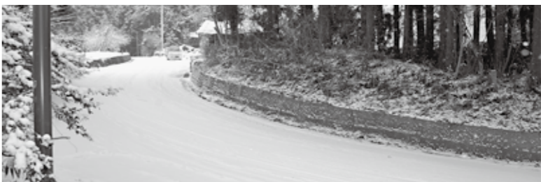
整備改良が必要な町道上街道線

問 町道上街道線の整備改良が必要な町道上街道線が、大槻田付近は坂が急で、急カーブで見通しが悪く、危険であり改良を急ぐべきだ。また、大槻田線、下田線、桜森線の改良の見通しについて伺う。