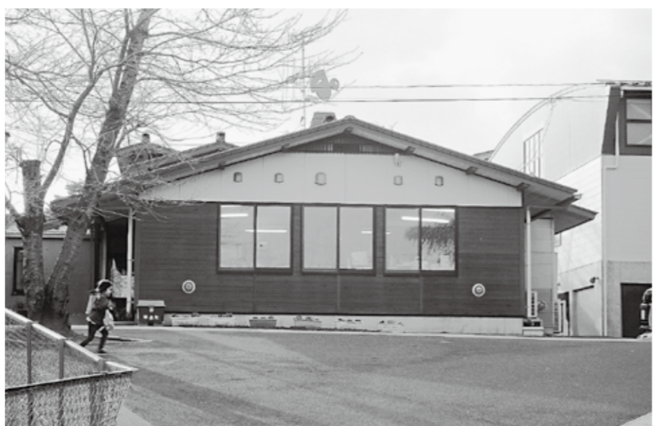
職員の増員と増築が待たれる平泉保育所

また、平泉幼稚園は3歳児から5歳児で46人の入所見込みとなっている。年齢的にはばらつきがあるが、ここ数年入所児童は増加傾向にある。保育所、幼稚園について、今後とも入所需要は高まる状況が続くことが予想される。