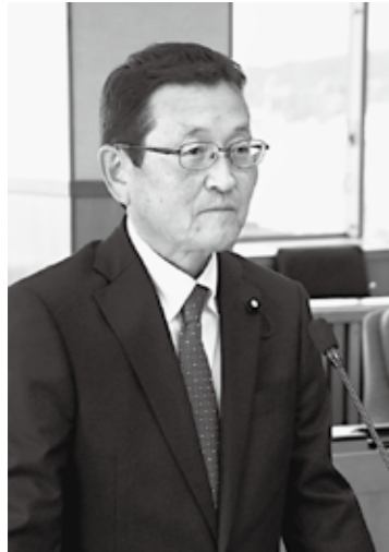
真 筧 光 幸 議員