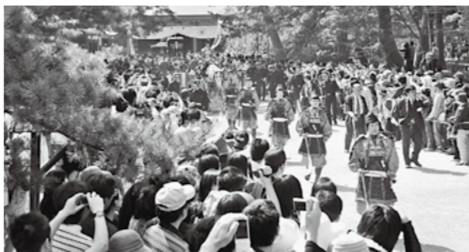
藤原祭り東下り行列

インバウンド対策は花巻市、遠野市連携、県際4市町連携を中心に東アジアを対象とした現地プロモーション活動や旅行会社、*パワープログラマー、インフルエンサー招請