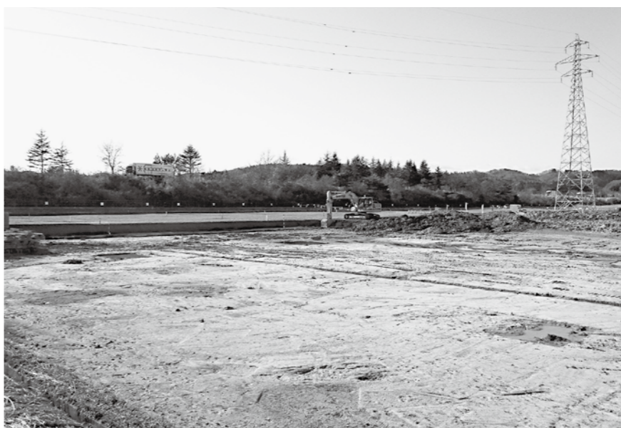
整備が進む1,100台の駐車場（町道祇園線北側）

建設水道課長 騒音等については、環境基本法に定めた基準があり、それを超える場合は、ネクスコから遮音壁等の