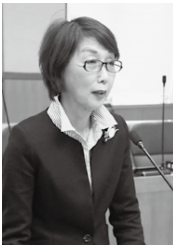
升沢 博子 議員