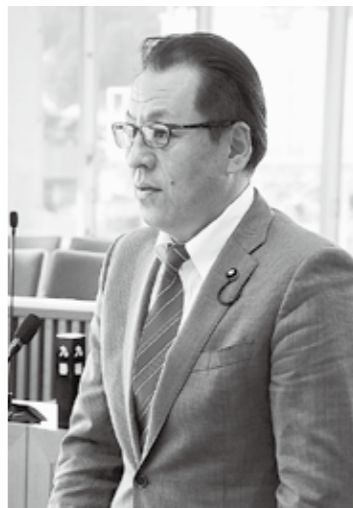
高橋 拓生 議員