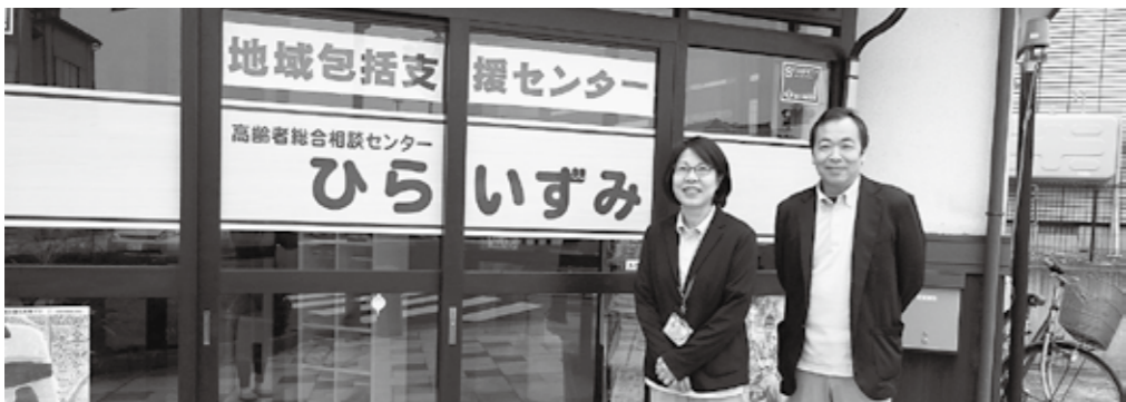
高齢者総合相談センターひらいずみ 昨年11月から相談支援にあたる皆さん