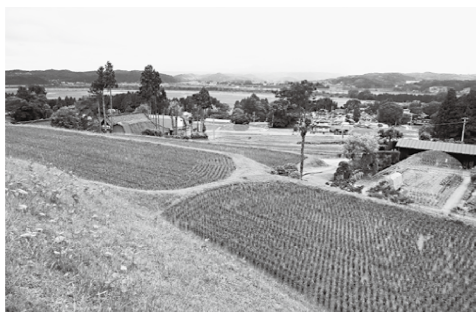
束稲山麓の棚田の風景

問 企業誘致に関して、農業への異業種参入を図る大企業が農場を展開している。本町においてそのような観点