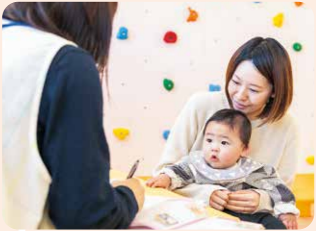
ピヨピヨ広場 保健センター内に開設している、1歳未満の赤ちゃんと保護者を対象にした交流広場です。毎月身長と体重の測定をしたり、絵本の読み聞かせをするなど、育児の不安や悩みを少しでも緩和するためのスペースです。イベントなども毎月企画され、子どもたちの健やかな成長を手助けしています。

春からは息子が保育園に通い始めますが、広い園庭と園舎でのびのび遊べる環境を楽しみにしています。町立図書館が入る「エピカ」にも、もっと行きたいですね。幼児向けのボルダリングや遊具があるキッズスペースもこれから活用したいです。平泉町は、チラシや広報による情報発信が多いですが、インターネットでも子育て情報にアクセスできると助かります。また、子どもが遊べる公園や家族が暮らしやすい住まいなど、さらに充実していくことを願っています。