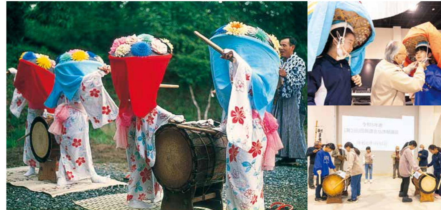
長島の東松寺をホームグラウンドに、申し人（もうしと）4人と、2組の子どもたち4人が活動している田頭讚念仏保存会