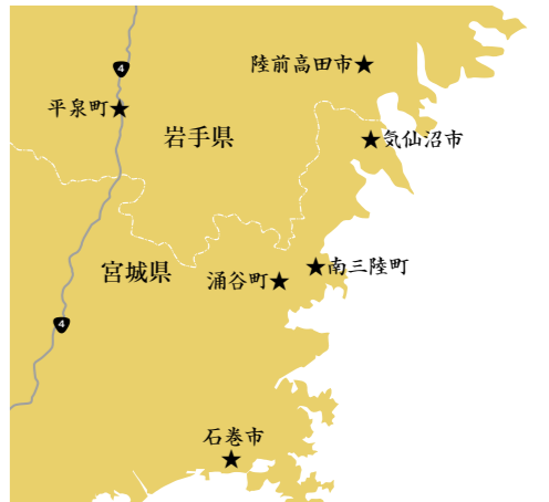
日本遺産「みちのくGOLD浪漫」構成市町

※「日本遺産 (JapanHeritage)」とは、地域の歴史的魅力や特色を通じて我が国の文化・伝統を語るストーリーを「日本遺産 (JapanHeritage)」として文化庁が認定する制度です。