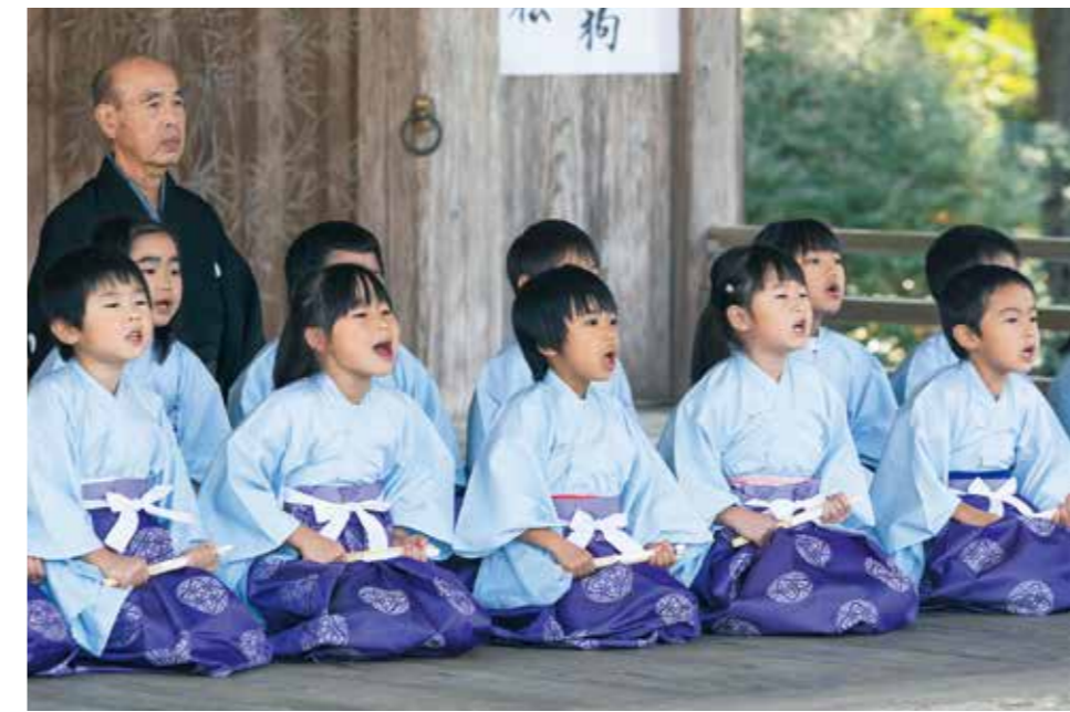
平泉町立幼稚園、平泉保育所による「謡」では、伝統文化に触れることで平泉を理解する心を育みます

2024(令和6)年には町と中学生とが共同で「ひらいずみのSDGs」のロゴマークを制作。子どもたちとともに、持続可能なまちづくりについて考える機会になりました。