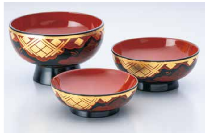
秀衡塗は菱形の金箔と源氏雲や草花を組み合わせた縁起の良い漆絵がほどこされ、素朴ながら華麗な味わいが特徴