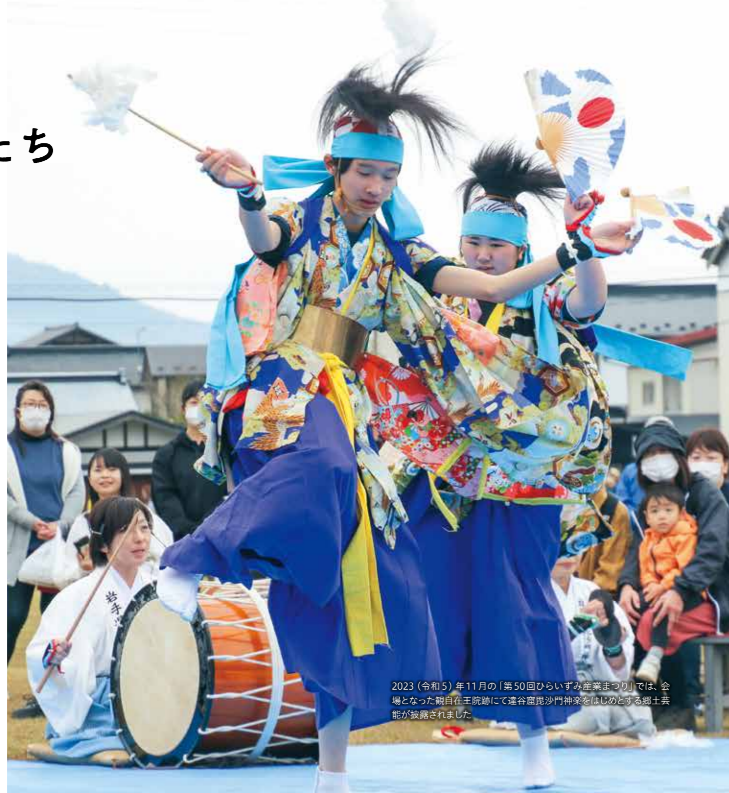
2023（令和5）年11月の「第50回ひらびらずみ産業まつり」では、会場となった観自在王院跡にて達谷窟毘沙門神楽をはじめとする郷土芸能が披露されました