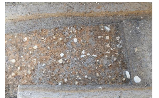
写真 5 北側調査区の石敷（西から）