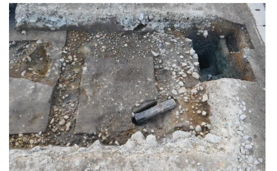
写真 4 南側調査区の石敷（東から）

○石敷：南側調査区で見つかった石敷は、粘土に埋め込まれた 10cm 強の石と、それよりもやや上位で見つかった 10cm 弱の小ぶりのものがあることから、昨年度の調査と同様に新旧二時期の可能性を考えています（写真 4）。北側調査区では 10cm 弱の石が疎らに見つかりました（写真 5）。また、東西方向の溝跡が見つかった付近を境にして高低差があります。