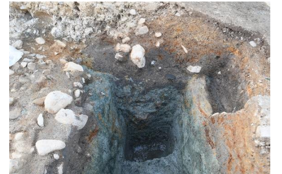
写真 3 溝跡（東から）

○溝跡：南側調査区の北端部で見つかった深さ 1 m 程度、幅約 70cm の溝跡です。底には砂が堆積していたことから水が流れていたと考えられます（写真 3）。平成 6 年度の第 9 次調査で今回の調査区と隣接する町道部分を発掘した際に見つかった溝跡の続きにあたる部分です。現在でもこの溝跡に沿って U 字溝が造られており、昭和の整備以前からこの場所が用水路に使われていたとみられます。