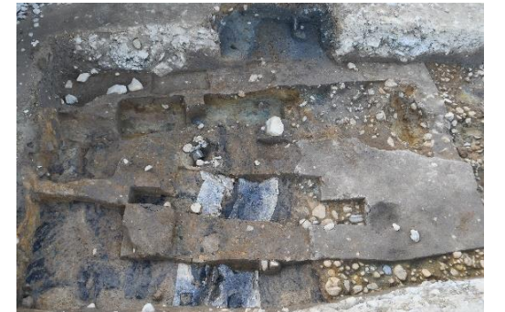
写真 2 再確認した導水路（東から）

○導水路：4 次調査では毛越寺北側の弁天池方向から舞鶴が池への導水路が確認されています。今回の調査では南側調査区でこの導水路を再確認し、幅は 55cm 前後、深さは石敷の面から 10cm 前後であることを確認しました（写真 2）。